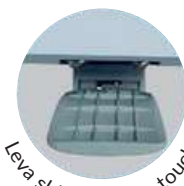
Leva sblocco piano touch

393 9851838 • info@kommit.it • www.kommit.it