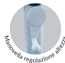
Manovella regolazione altezza